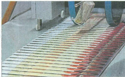
L'imprimerie travaille avec de nombreuses institutions pour sortir les magazines, des dépliantes...